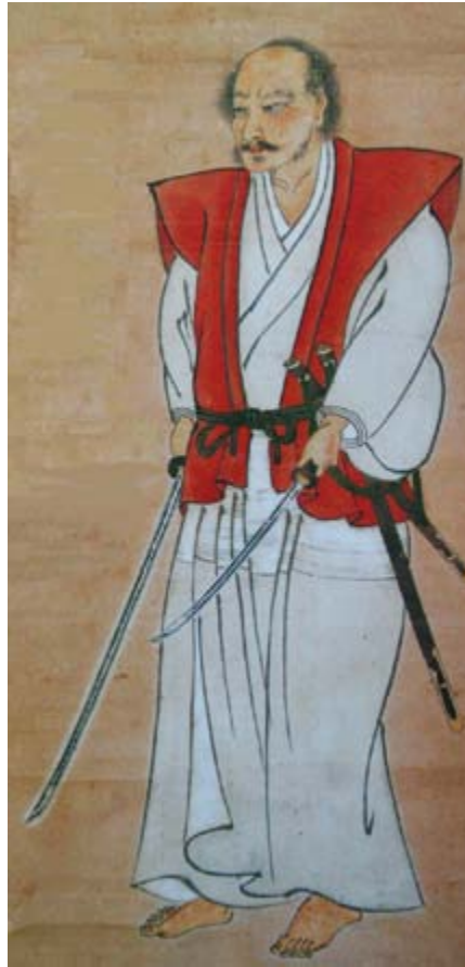
Borilački pokret kao tema također je popularan i u azijskoj umjetnosti

Još veći broj umjetničkih djela koja su prikazivala scene lova i borbi s divljim životinjama nastala su tijekom romantizma.