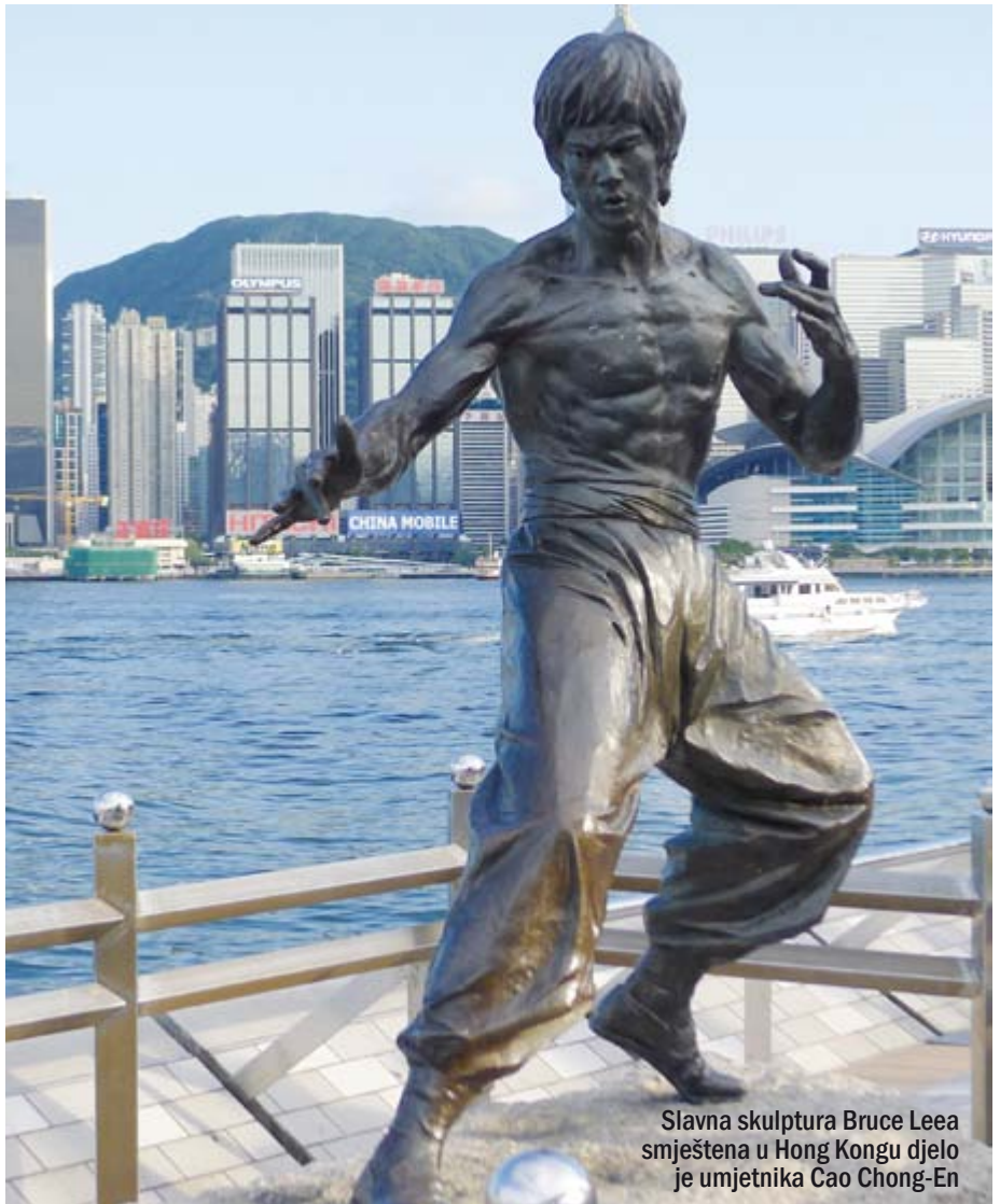
Slavna skulptura Bruce Leea smještena u Hong Kongu djelo je umjetnika Cao Chong-En

Godine 1935. u gradu Katchu Chong (Koreja) pronađene su različite kipove i slike. Nalazili su se u grobnici Muyong Chong i potiču iz trećeg stoljeća. (dinastija Koguryo). Na stropu grobnice Sam Sil je slika koja prikazuje ratnike u različitim