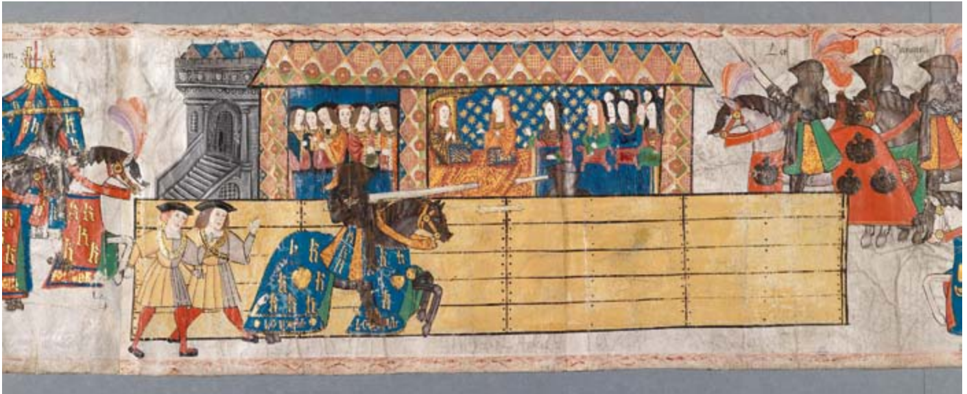
Slika turnira Henryja VII koja se čuva u Londonu

Međutim, važno je napomenuti da se vrijednost umjetničkog djela ne oslanja samo na fizički pokret i djelovanje prikazanog tijela, već i na kvalitetu umjetničkog djela. Balansiranje vizualnih i sportskih elemenata kao i tjelesne kretnje nešto je što čak i najveći umjetnici pronalaze velikim izazovom. Prikazi pokreta ovise, ne samo o viziji samog umjetnika nego i trendu vremena u kojem je umjetničko djelo nastalo.