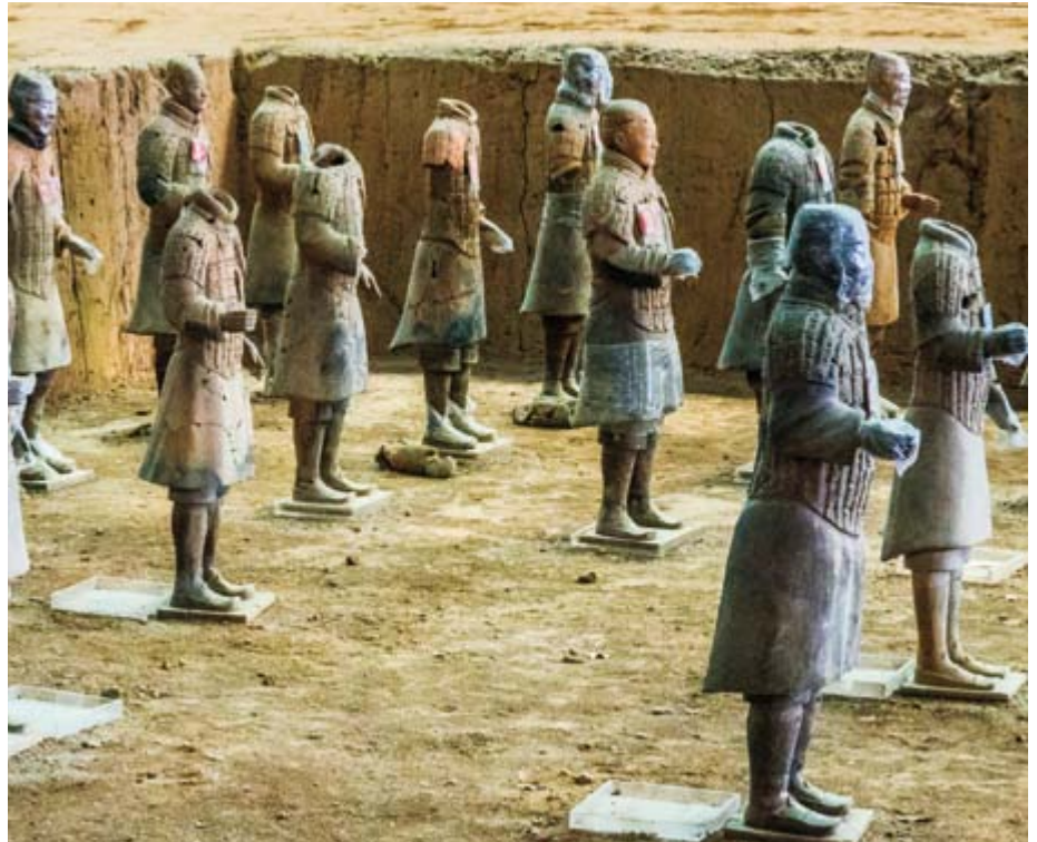
Poznati grob s terakota ratnicima (grob prvog cara Qin Shi Huang Di) otkriven je 1974. godine

Eugene Delacroix's Lov na tigra (Pariz) ili crtež Lav napada arapskog konjanika (Harvard) značajni su primjeri toga. Slika Hrvač slikara Gustava Courbeta, bila je prekretnica u prikazu sporta i osnovica je suvremenog pogleda na sport. Honore Daumier, otac karikature, često je nalazio inspiraciju u prikazima boksača, hrvača itd. Njegova djela su danas pohranjena u Parizu. Francuski kipar Antonine Bourdele isklesao je snažan kip Heraklesa kao strijelca, a hrvatski kipar Ivan Meštović imao je jedinstven talent spajanja snage forme i dinamike pokreta. Njegov rad se danas čuva u Grand Parku u Chicagu i prikazuje Indijance kao strijelce i kopljanike.